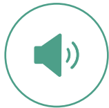
Lautsprecher mit Harman-Soundtechnologie